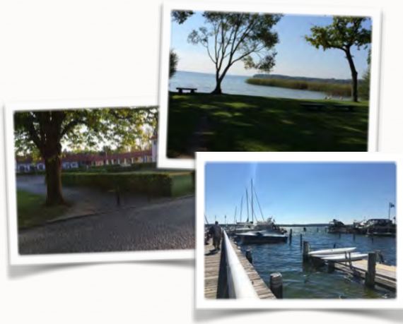
Bad Saarow Impressionen

Träumten die Rittergüter Saarow und Pieskow zu Fontanes Zeiten noch vor sich hin, begann vor rund 100 Jahren der Wandel vom kleinen Erholungsort zum „Staatlich anerkannten Thermalsole- und Moorheilbad“. Heilkräftiges Moor und Thermalsole kommt aus der 450 Meter tiefen Catharinenquelle, Schmucke Villen und Landhäuser entstanden und lockten die Berliner Gesellschaft in den Goldenen Zwanzigern an den Scharmützelsee.