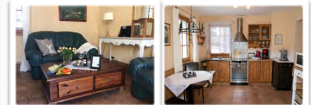
gemütliches WZ mit Kaminofen

OG über offene Treppe großer Schlafbereich mit Doppelbett und kuschliger Sitzecke