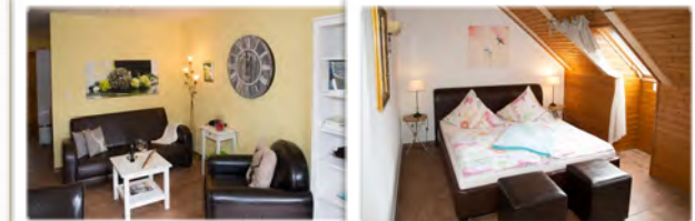
Wohnzimmer mit Kaminofen Schlafzimmer mit 2. TV

OG zwei Schlafräume mit 1 Doppelbett , zwei Einzelbetten, Aufbettungen möglich, Babyausstattung, WC, Kinderschutzgitter